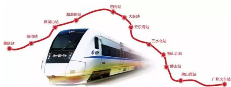
(广佛肇城轨站点规划图)

狮山镇相关负责人则表示，为发挥狮山站的辐射带动能力，开展了包括兴业路、博爱路、红星路、桃园路等周边主干道路的提升改造，提升改造道路约61公里，进一步完善了道路交通出行状况，加强了该区域综合交通运输能力。